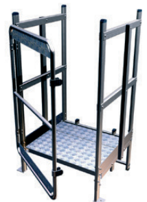
Palier de sortie frontale + pieds réglables avec portillon h max : 275 mm