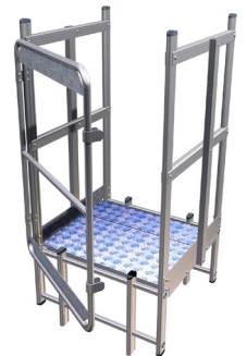
Palier de passage d'acrotère + redescente avec portillon Ref: UPPA