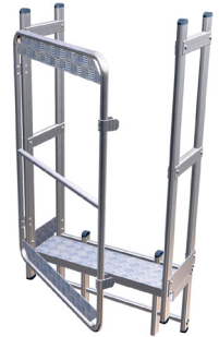
Marche palier avec portillon Ref: UMP-1+EUKPSF-2