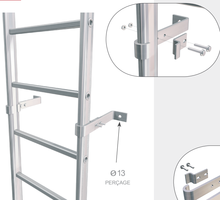
PATTES DE FIXATION STANDARDS