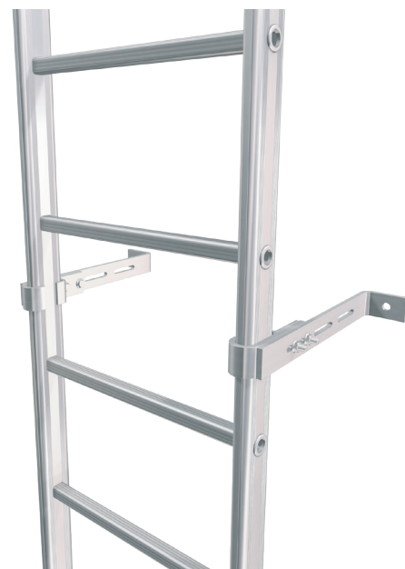
PATTES DE FIXATION RÉGLABLES