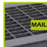
MAILLE ANTI TALONS 30 X 10