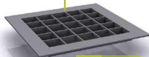
MAILLE STANDARD 30 X 30

Existe en cranté simple et double (antidérapant) Maille 20X20 normes APH et PMR